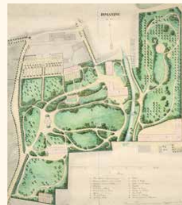
Plan der Ismaninger Schlossanlage aquarellierte Handzeichnung, 1837

Der bei Einheimischen wie Besuchern gleichermaßen beliebte Schlosspark ist nicht nur die grüne Lunge Ismanings, sondern auch ein Kulturdenkmal, das über den Ort hinaus Bedeutung hat. 1807 wurde der vormals barocke Park vom Gartenarchitekten