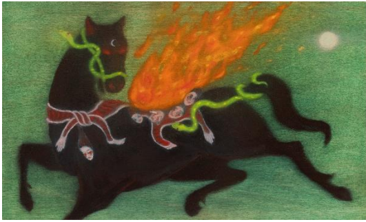
Javkhlan Ariunbold Wind Horse 2026 Öl auf Holz 30 x 50 cm Copyright VG Bild-Kunst, Bonn 2026