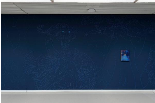
Javkhlan Ariunbold Das Lied des Panther-Drachen 2024 Ausstellung zum GWK-Förderpreis im Kunstmuseum Bochum, Installationsansicht