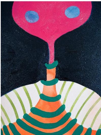
Kallirroi Ioannidou Sipping the last drop 2025 Öl und Tusche auf Baumwolle 120 x 100 cm (Ausschnitt) Copyright: Kallirroi Ioannidou