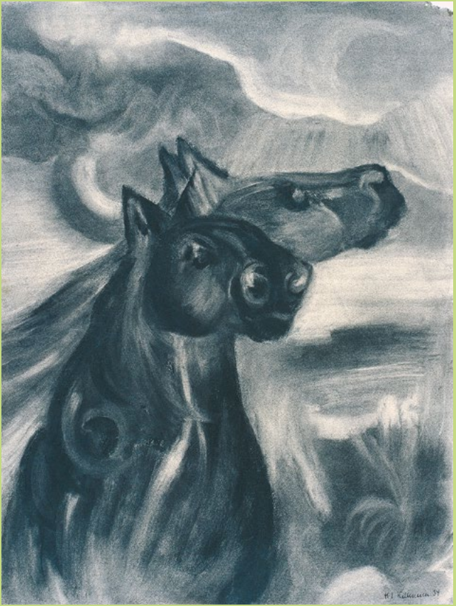
Hans Jürgen Kallmann · Geisterpferde · 1934 · Kohle auf Papier · 62 × 45 cm

Copyright die Künstler*innen sowie VG Bild-Kunst, Bonn 2026 (Javkhlan Ariunbold, Hans Jürgen Kallmann)