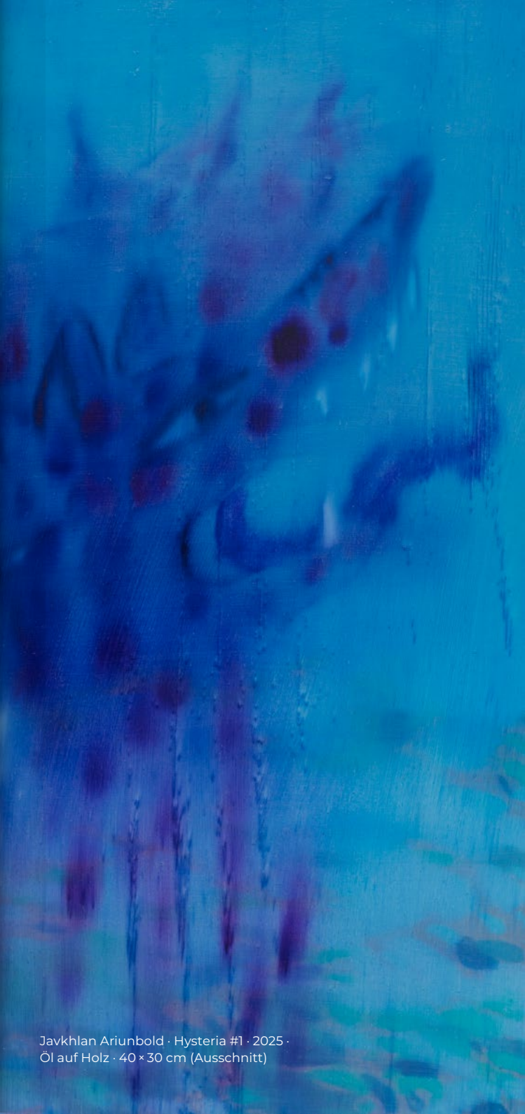
Javkhlan Ariunbold · Hysteria #1 · 2025 · Öl auf Holz · 40 × 30 cm (Ausschnitt)